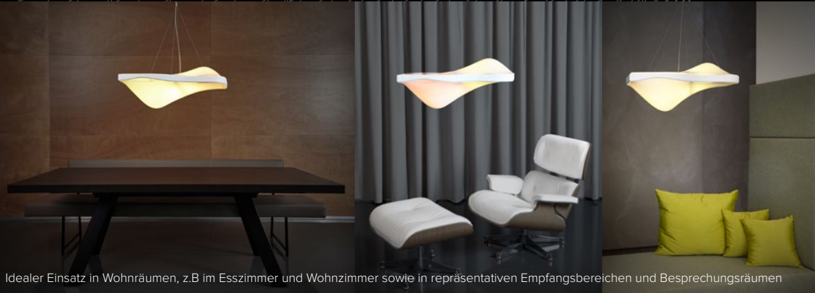
Idealer Einsatz in Wohnräumen, z.B im Esszimmer und Wohnzimmer sowie in repräsentativen Empfangsbereichen und Besprechungsräumen